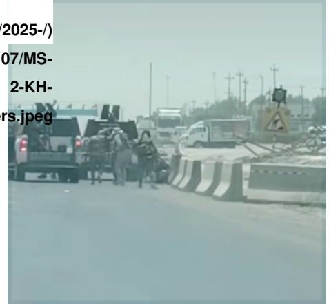
الشكل 2: مقاتلو 'كتائب حزب الله' يطلقون النار على قوات الأمن العراقية؛ 27 تموز/يوليو 2025.

"أولئك الذين يستغلون البيانات الرسمية التي غالباً ما تصدر على عجل قبل الانتهاء من التحقيقات الرسمية للتصيد في المياه العكرة" (الشكل 4).