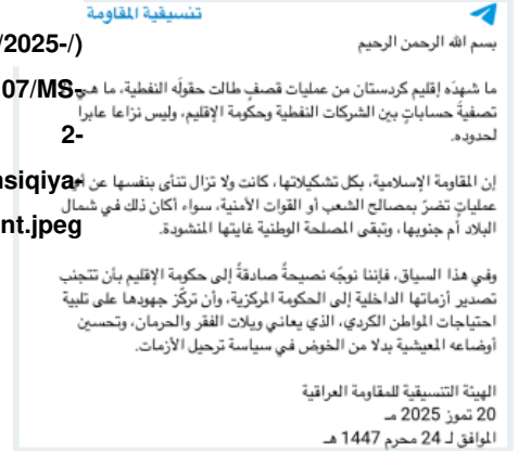
الشكل 2: بيان "التنسيقية"، 20 تموز/يوليو 2025.

وفي هذا السياق، فإننا نوجه نصيحة صادقة إلى حكومة الإقليم بأن تتجنب تصدير أزماتها الداخلية إلى الحكومة المركزية، وأن تركز جهودها على تلبية احتياجات المواطن الكردي، الذي يعاني وبيلات الفقر والحرمان، وتحسين أوضاعه المعيشية بدلاً من الخوض في سياسة ترجيل الأزمات.