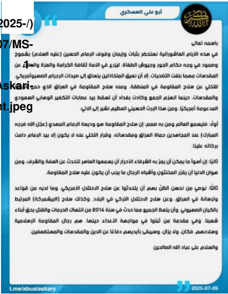
الشكل 1: بيان أبو علي العسكري، 5 تموز/يوليو 2025.

للمقاومة العراقية" أو "التنسيقية" للاختصار صمتها الطويل وأصدرت أول بيان لها منذ أكثر من عام لتتبرأ الميليشيات رسمياً من غارات الطائرات المسيّرة وقد تم استبدال اسم "التنسيقية" القديم إلى حد كبير باسم "المقاومة الإسلامية في العراق، https://www.washingtoninstitute.org/policy-analysis/profile-islamic-resistance-iraq " بعد 7 تشرين الأول/أكتوبر 2023. وقد تُشير عودة استخدام المسمى القديم إلى تحول في موقف الميليشيات نحو تركيز أكبر على الشؤون الداخلية في أعقاب الحرب الأخيرة بين إيران وإسرائيل وجاء في البيان: