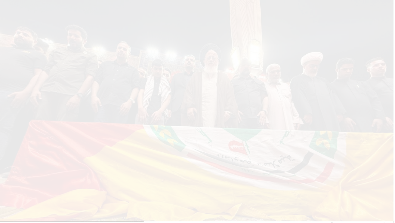
الشكل 2: ممثل المرشد الأعلى الإيراني يُصلي على جثمان الموسوي في النجف، 27 حزيران/يونيو 2025.

رغم ان الواقع يكشف ان اغلبها لم يشارك بشكل فعلي في هذا الصراع