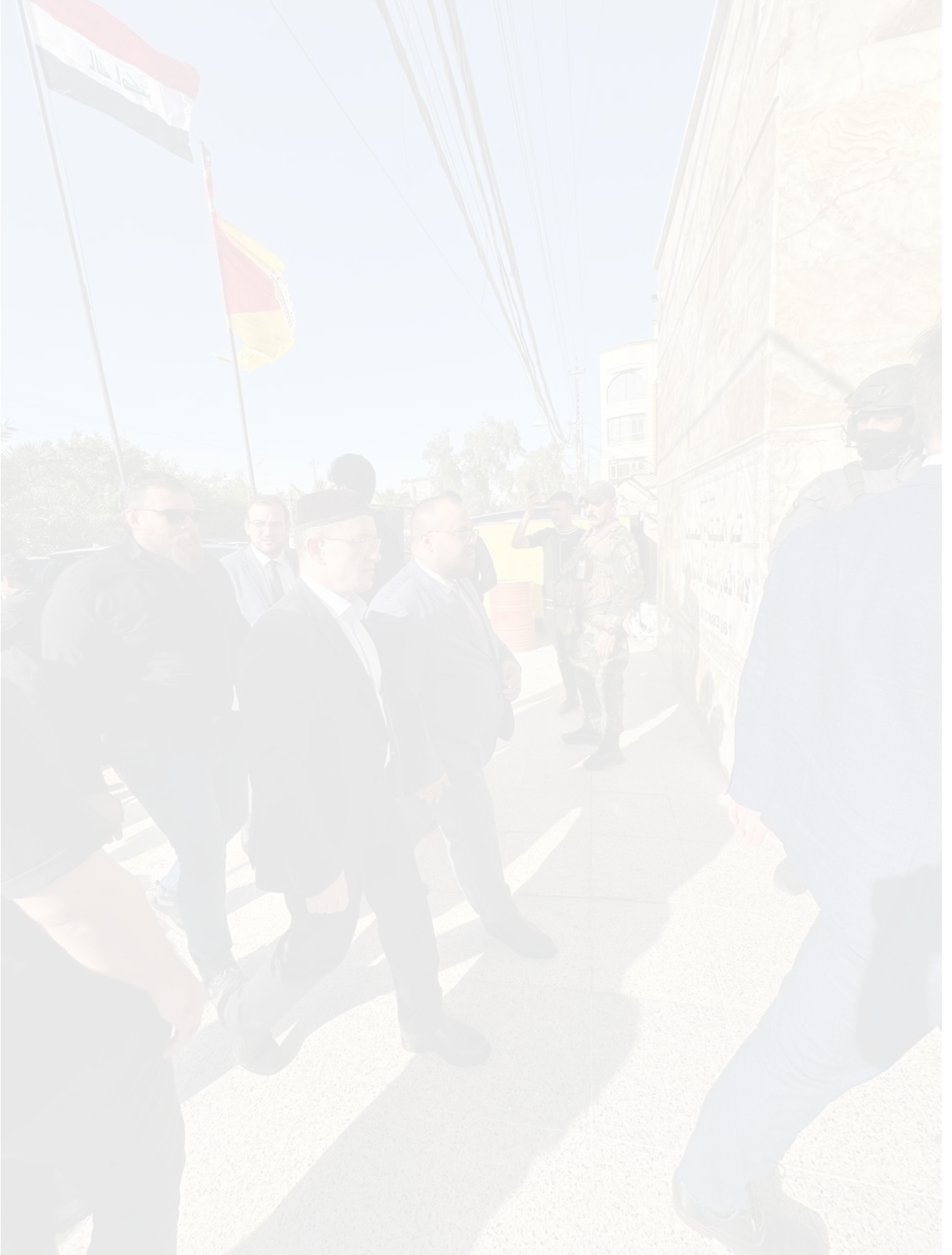
الشكل 5: السفير الروسي لدى العراق يحضر مراسم الذكرى 25 حزيران/يونيو 2025.

تعزز هذه الروابط ومظاهر التضامن الرأي القائل إن جماعة "كتائب سيد الشهداء" تستحق رقابة دقيقة بوصفها أحد الوكلاء المسلحين الأساسيين لإيران. وإذا قرر "فيلق القدس" إعادة تنشيط الخلايا المسلحة ( https://www.washingtoninstitute.org/policy-analysis/uli-al-baas-part-2-key-analytic-findings ) داخل سوريا لاستهداف إسرائيل أو الحكومة السورية الجديدة، فإن "كتائب سيد الشهداء" ستكون من أبرز الخيارات المطروحة لتوفير الدعم اللازم