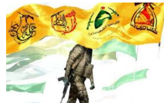
الميليشيات العراقية تُخضع من عملياتها ضد إسرائيل

(ar/policy-analysis/kyfyf-astkhdam-mqalat-slsf-aldwa-alkashft-ilmlyshyat)