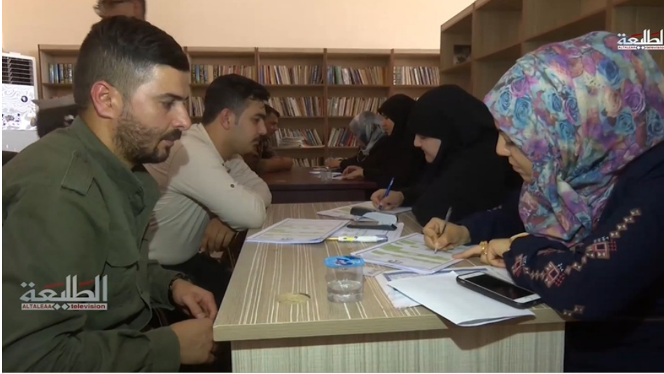
Figure 1: DENIS background check