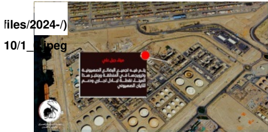
الشكل 1: مقطع فيديو لكتائب 'كتائب صرخة القدس' 13 تشرين الأول/أكتوبر 2024

- منشآت الغاز في المملكة العربية السعودية (المواقع غير محددة)