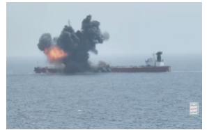
هجمات الحوثيين على الناقلات المرتبطة بروسيا (ar/policy-analysis/hjmat-alhwthyyn-ly-alnaqlat-almrtbtt-brwsya/)