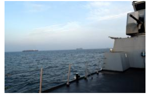
تتبع بعد هجمات الحوثيين تعود ناقلات النفط المرتبطة بروسيا إلى البحر الأحمر (ar/policy-analysis/hty-bd-hjmat-alhwthyyn-twd-naqlat-ainft-almrtbtt-brwsya-aly-albhr-alahmr/)