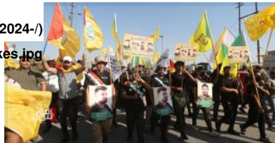
الشكل 1: تشيع عناصر من 'كتائب حزب الله' بعد الهجمات على جرف الصخر في 30 تموز/يوليو 2024.

sites/default/files/2024-/) 20following%20the%20July%2030%2C%202024%20strikes.jpg