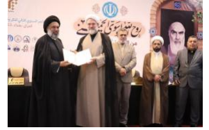
لمحة عامة: جامعة المصطفى العالمية – (مفتية العراق) (ar/policy-analysis/lmht-amt-jamt-almstfy-alalmyt-mmthlyt-araq/)