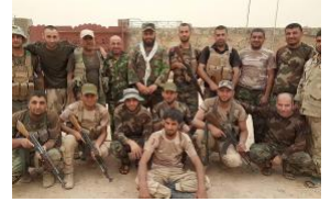
لمحة عامة: "حشد الشبك" اللواء 30 (قوات الحشد الشعبي العراقي) (ar/policy-analysis/lmht-amt-hshd-alsbk-allwa-30-qwat-alhshd-alsby-araq/)