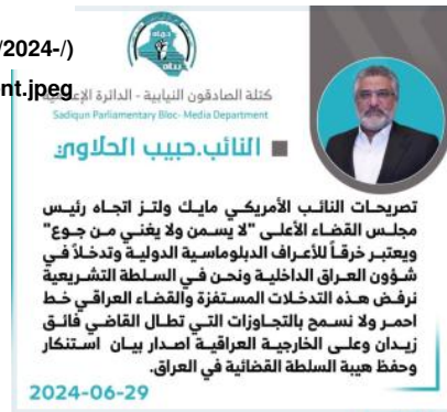
Figure 4. Habib al-Helawi statement in defense of Zaidan, June 29, 2024

sites/default/files/2024-/) (07/Helawi%20statement.jpeg