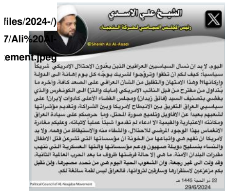
Figure 3. Ali al-Asadi statement in defense of Zaidan, June 29, 2024