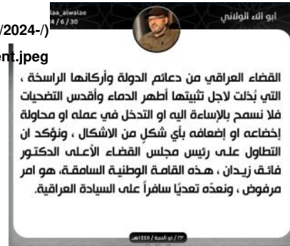
Figure 1: Abu Ala statement in defense of Zaidan, June 30, 2024.

الثاني/يناير 2024 للدفاع عن زيدان وفي هذا الإطار أصدر قائد "حركة حقوق" وهي الجبهة السياسية لهذه الجماعة والمصنفة إرهابية بياناً يدعم فيه زيدان جاء فيه: "ندين بأشد العبارات ما صدر عن أحد أعضاء الكونغرس الأمريكي تجاه السلطة القضائية العراقية وتحديداً رئيس مجلس القضاء الأعلى الدكتور فائق زيدان وهذا ما يؤكد أن مثل هذه التصريحات (المدفوعة الثمن) لا قيمة لها في بلدنا الرافض لسياسة واشنطن العدوانية". (الشكل 2)