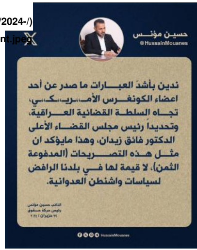
Figure 2. Hossein Moanes statement in defense of Zaidan, June 29, 2024

sites/default/files/2024-/) (07/Moans%20statement.jpeg