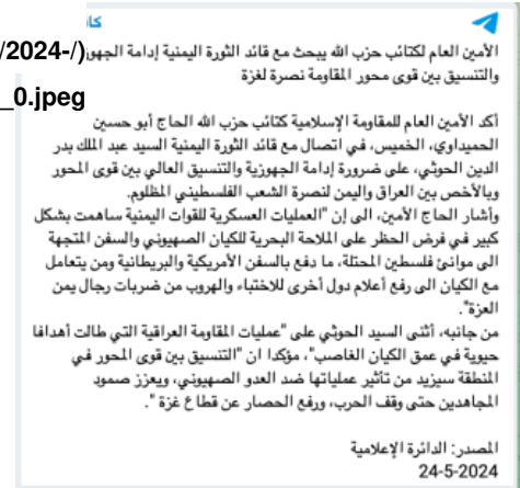
Figure 2: KH statement about Abu Hussein calling al-Houthi, May 24, 2024

وصدر إدعاء ثانٍ عن شن هجمات مشتركة في 12 حزيران/يونيو وهذه المرة أشارت "المقاومة الإسلامية في العراق" بأنها نفذت عمليتين عسكريتين مشتركيتين مع القوات المسلحة اليمنية استهدفت "هدفاً حيواً في مدينة إسدود بالصواريخ" والثانية استهدفت "هدفاً مهماً في مدينة حيفا بواسطة الطيران المسيّر" (الشكل 4).