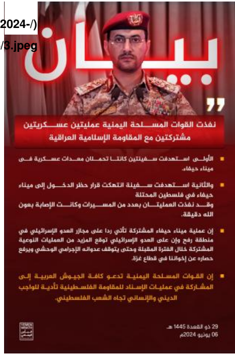
Figure 3: Houthi statement about purported joint attacks with the IRI on June 6, 2024.

ولم يُذكر نوع الصواريخ التي رُعم أنها استخدمت في هذه الضربة لكن إطلاقها بدا مشابهاً لعمليات إطلاق سابقة نفذتها "المقاومة الإسلامية في العراق". ويُعد هذا خروجاً عن الأسلوب المعتاد في الأشهر الأخيرة والمتمثل في وصف الصواريخ المستخدمة في جميع