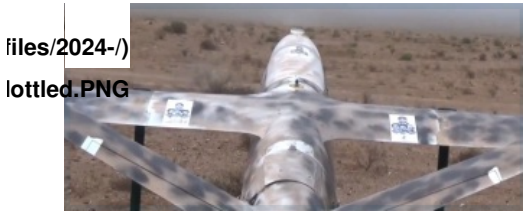
Figure 2: Mottled camouflage on the Sammad/KAS-04 V-tail drone shown in the May 2 claim, reminiscent of World War II-era 'shark' skin techniques

وفي وقت سابق من هذا العام بذلت "كتائب حزب الله" جهداً آخر لإحياء سمعتها من خلال تعليقات حول مستقبل "المقاومة" في البحرين □ ففي 9 كانون الثاني/يناير أُجرت "قناة الميادين" مقابلة