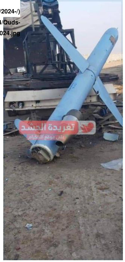
Figure 1: Iranian-built Quds-type cruise missile in Babil, Iraq, January 2024.

سلسلة "القدس" ضد إسرائيل (الشكل 1). واستخدمت في حوالي ثلاثة اربع الهجمات المزعومة ضد إسرائيل في كانون الثاني/يناير غير محددة وظهرت الطائرات المسيّرة الهجومية أحادية الاتجاه "شاهد-101" "أكس تابل" في الصور المصاحبة والتي تُظهر مزجاً من عمليات الإطلاق الليلية والنهارية التي لا يمكن ربطها بشكل مؤكد بالصواريخ المصنوعة في العراق (2024-04/Quds-cruise-missile-in-Babil%20Jan%202024.jpg)