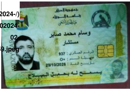
نصیر ۲؛ کارت عضویت ابوباقر الساعدی در حشد شعبی که بیانگر نقش او به عنوان مشاور است

در گردان‌های حزب‌الله داشت که امریکا او را به عنوان تروریست و نقض‌کننده حقوق بشر تحریم کرده است https://home.treasury.gov/news/press-releases/sm847