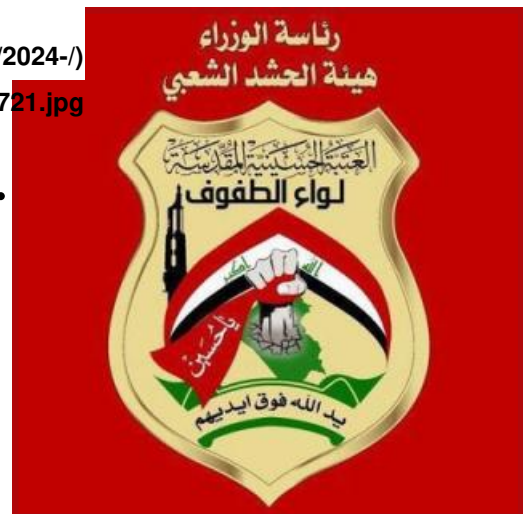
Liwa al-Tafuf logo

amwt-n-ktayb-hzb-allh) أبو مهدي المهندس الذي كان مصنفاً على