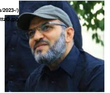
Figure 1: Photogenic murderer Abu Ala al-Walal

وتُعد "كتائب سيد الشهداء" إضافة مفيدة إلى قائمة الجماعات الإرهابية التي يقودها العراق والتي تلعب أدواراً رسمية في الدولة العراقية وتشمل "كتائب حزب الله" و"عصائب أهل الحق" (https://www.washingtoninstitute.org/ar/policy-analysis/lmht-amt-n-sayb-ahl-alhq) و"حركة حزب الله النجباء" (https://www.washingtoninstitute.org/ar/policy-analysis/lmht-amt-n-hrkt-hzb-allh-alnjb) وكما هو الحال مع هذه الجماعات الثلاث المصنفة على قائمة الإرهاب الأمريكية تدير "كتائب سيد الشهداء" أيضاً لواء من أوعية "قوات الحشد الشعبي" (اللواء الرابع عشر) والذي تدفع الحكومة العراقية رواتبه وتزوده بالإمدادات مما يؤكد بصورة أكثر دقراً الدولة في تقديم الدعم المادي للكائنات المصنفة على قائمة الإرهاب الأمريكية.