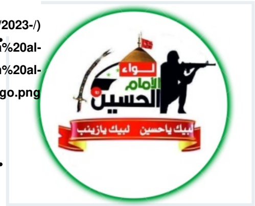
Liwa al-Imam al-Hussein logo