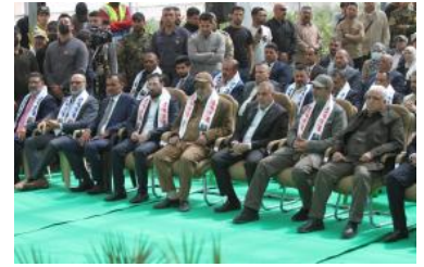
كيفية استخدام مقالات سلسلة "الأضواء الكاشفة للمليشيات": اللمحات العامة

(ar/policy-analysis/kyfyt-astkhdam-mqalat-slslt-aladwa-alkashft-ilmlyshyat-allmhat-alamt/)