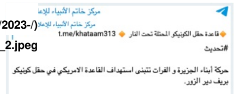
Figure 2: An Iraqi muqawama Telegram channel claims Sons of the

ولم تصدر "حركة أبناء الجزيرة والفرات" بحد ذاتها أي بيان تعلن فيه مسؤوليتها عن الهجوم الصاروخي الذي وقع في 26 تشرين الأول/أكتوبر على قاعدة "كونوكو" ولكنها لم تنف أيضاً نسب الهجوم لطرف ثالث عبر الإنترنت وبدلاً من ذلك وقبل ساعات قليلة من الهجوم