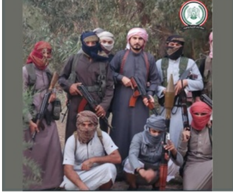
Figure 3: Sons of the Jazira and Euphrates Movement's social media talks about a meeting to 'determine the time for the attack', October 26, 2023