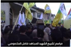
Kataib Hezbollah Publicly Mocks Asaib Ahl al-Haq for Cowardice

(/policy-analysis/pnj-hmlh-ddamrykayy-dr-raq-w-swryh-az-yk-grwh-pwshshy-mrtbt-ba-ayran/)