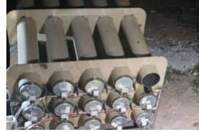
پیچ حمله ضدآمریکایی در عراق و سوریه از یک گروه پوششی مرتبط با ایران

(/policy-analysis/how-use-militia-spotlight)