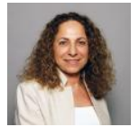
نعومي نيومان (ar/experts/nwmy-nywman/)

نعومي نيومان هي زميلة زائرة في معهد واشنطن حيث تركز على الشؤون الفلسطينية وعملت سابقاً كرئيسة لوحدة الأبحاث في وكالة الأمن الإسرائيلية أو "الشاباك" وفي وزارة الخارجية الإسرائيلية ومؤخراً بدأت نيومان دراسة الدكتوراه في جامعة تل أبيب