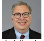
ديفيد ماكوفسكي (ar/experts/dyfyd-makwfsky-0/)

وهار بالتّي شغل مؤخراً منصب رئيس "المكتب السياسي العسكري" في وزارة الدفاع الإسرائيلية