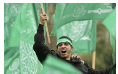
سرزنش و محکومیت حماس از سوی اعراب تا پیش از ۷ اکتبر ۲۰۲۳

( fa/policy-analysis/waknshhay-bynalmly-bh-hmlh-hmas-bh-asrayyl/ )