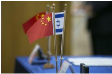
Tracking Chinese Statements on the Hamas-Israel Conflict (/policy-analysis/tracking-chinese-statements-hamas-israel-conflict)