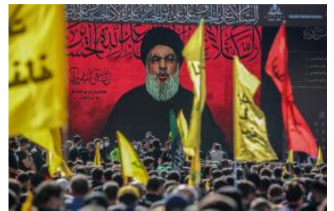
عماذا قال نصر الله فعلاً ولماذا (ar/policy-analysis/madha-qal-nsr-allh-flaan-wlmadha/)