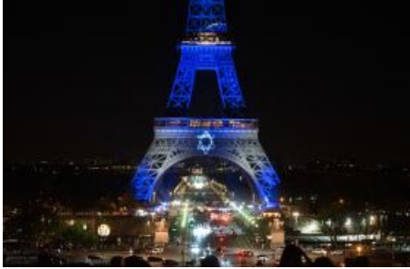
International Reactions to the Hamas Attack on Israel (/policy-analysis/international-reactions-hamas-attack-israel)