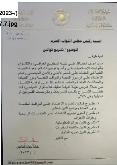
Figure 5: Maliki's State of Law Alliance asks for the process of passing an anti-homosexuality law to be expedited, July 17, 2023.

الجنس الآخر (من الجدير بالذكر sites/default/files/2023-/)Alshammari 10/4%2C%2018.07.jpeg ملابس نسائية). ومن شأن القانون المقترح أن يعاقب