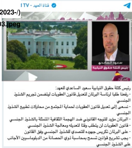
Figure 3: Saud al-Sa'eedi says parliamentarians have submitted a request to amend the penal code to include criminalization of homosexuality, July 3, 2023

sites/default/files/2023-/ (10/3.%20July%202023.jpeg)