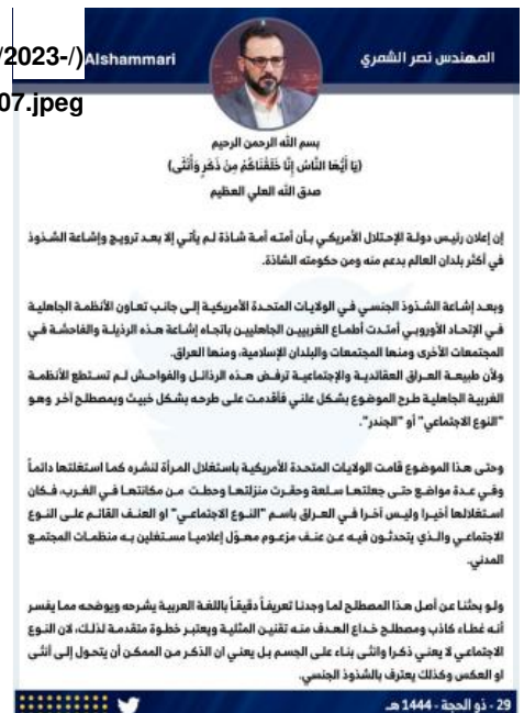
Figure 4: Nasr al-Shammari attacks the West on gender issues, July 18, 2023.

الجنس الآخر (من الجدير بالذكر sites/default/files/2023-/)Alshammari 10/4%2C%2018.07.jpeg ملابس نسائية). ومن شأن القانون المقترح أن يعاقب