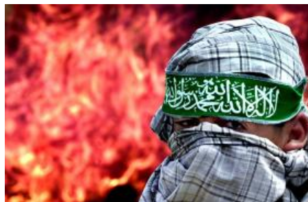
مقاله‌ها و دیدگاه‌ها

(fa/policy-analysis/qdrtnmayy-hzballh-jnwby-ymn-dr-mrasm-salrwz-kwdta/)