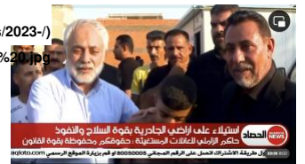
Figure 1: Husein al-Zarifi (right) visits Jadiriyah, August 13, 2022.

وضعت التحركات الأخيرة التي قام بها آية الله العظمى علي السيستاني والجهات الفاعلة من المعسكر الصدري في العراق زعماء الميليشيات تحت الأضواء ويعود السبب في هذه الحالة إلى أن أعضاء "الإطار التنسيقي" الذي هو أهم تحالف سياسي للميليشيات كانوا منخرطين في السرقة المتفشية للممتلكات وقام السياسي الصدري المفير للجدل حاكم الرمادي - الذي كان على صلة بالتهنكات خفيفة لحقوق الإنسان في الماضي - على غرار شخصيات الميليشيات الرئيسية - بزيارة حي الجادرية الراقي في بغداد في 13 آب/أغسطس برفقة طاقم تصوير من قناة "الشرقية" (الشكل 1). (وسبق أن بثت الشبكة تقريراً بتاريخ 31 أيار/مايو 2022 حول استيلاء الميليشيات المرتبطة بـ "الإطار التنسيقي" على عقارات الجادرية (انظر الشكل 2).