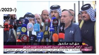
Figure 4: Al-Ahd TV gathers witnesses on August 22 to deny Jadrifah property seizures