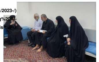
Figure 3: Meeting between Jadiriyah residents and Grand Ayatollah Al-Sistani on August 19, 2022.

وفي 13 آب/أغسطس أعلن هشام الركابي أحد مستشاري رئيس الوزراء ومدير المكتب الإعلامي لرئيس "الائتلاف دولة القانون" نوري المالكي أن السويدي ووجه وزير الداخلية بالتحقيق في قضية التجاوز على أراضي المواطنين في الجادرية كما وجه مكتبه بالتواصل مع الأهالي المتضررين من جراء التجاوز على ممتلكاتهم. ومع ذلك لم يعهد مكتب السويدي بنفسه إلا في 19 آب/أغسطس - أي