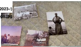
Figure 2: Al-Sharqiya TV report from May 31, 2022, providing evidence that Jadiriyah residents were evicted from their lands by the closest person to the Sistani.