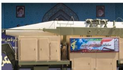
The Khoramshahr-1 debuts at a September 22, 2017, military parade in Tehran.

مزایای دیگر سوخت‌های خوداشتعال و اکسیدکننده این است که ساده‌اند گرچه بسیار سمی هستند. تکانه ویژه (انرژی پیشرانشی) بزرگ‌تری تولید می‌کنند و متراکم‌تر هستند و در نتیجه در مخازن کوچک‌تری قابل ذخیره هستند. از همه مهم‌تر به صورت ذخیره‌شده در مخازن سوخت و اکسیدکننده موشک که از مواد ویژه مقاوم در برابر خوردگی ساخته شده‌اند تا سال‌ها در دمای محیط دوام می‌آورند. این باعث می‌شود تا نیازی به تزریق سوخت به موشک پیش از پرتاب نباشد و زمان آمادگی را به میزان قابل توجهی از قرار به حدود ۱۵ دقیقه کاهش می‌دهد. (در مقابل یک موشک اسکاد کلاس بی (B) عادی بدون سوخت خوداشتعال و اکسیدکننده تقریباً شصت تا نود دقیقه وقت می‌گیرد تا مراحل پرتاب را کامل کند) گفته شده بازه نگهداری برای خرمشهر-۴ که حاوی سوخت باشد سه سال است منظور از این بازه رسیدن به نقطه‌ای است که سوخت موشک‌ها تخلیه می‌شود و مخازن پیش‌رانه آن‌ها پیش از سوخت‌گیری مجدد شسته می‌شود. در تئوری این دوره تا ده سال قابل افزایش است که با موشک‌های سوخت جامد ایرانی برابری می‌کند.