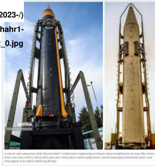
A side-by-side comparison of the Khoramshahr-3 (right) and Khoramshahr-4 (left) missiles, showing their respective configurations and modifications. The Khoramshahr-4 features a more complex, multi-stage structure, while the Khoramshahr-3 has a simpler, single-stage structure. The image highlights differences in their nose cone shapes, fin configurations, and overall dimensions.

sites/default/files/2023-/) 07/Khoramshahr1- (4compare2_0.jpg