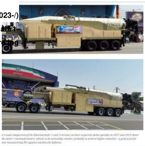
A visual comparison of the Khoramshahr-1 and 2 versions on their respective debut parades in 2017 and 2019 shows the latter's marked entry vehicle to be noticeably smaller, probably to achieve higher velocities—a good asset for not maneuvering 85% against anti-missile defenses.

sites/default/files/2023-/) 07/Khoramshahr1- (3compare.jpg