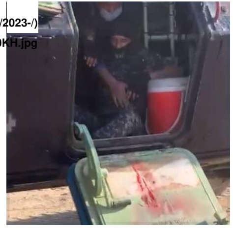
Figure 1: Federal Police injured by Katabh Hezbollah local fighters .in Albu Altha, May 15, 2023

برصاص "كتائب حزب الله". واستخدمت "الشرطة الاتحادية" الرشاشات الثقيلة للدفاع عن نفسها (https://www.facebook.com/SecMedCell/posts/pfbid02H5G8xiv2f28ipq3aYcN1TTjrxQrAx5ojBN9sZ1zyvCftM2Sz8c7kQjWgnEtA8t8DI?) (05/15/2023) (Figure%2003%20FP%20vs%20KH.jpg) العراق "بياناً"