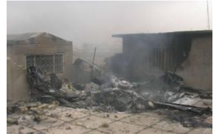
جماعة "أصحاب الكهف" توجه تهديدات جوية ضد المروحيات الأمريكية

(ar/policy-analysis/alahtfa-bakrm-alkby-fy-byanat-ywm-alsqds/)