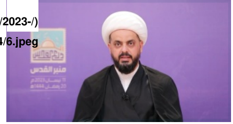
Figure 2: Qais al-Khazali delivers a recorded speech on Quds Day, April 14, 2023

ومن الجدير بالملاحظة أن هذا الاحتفال لم تحضره شخصيات قيادية مثل قائد "عصائب أهل الحق" أو زعيم "منظمة بدر" مخليين الساحة أمام الكعبي لإلقاء كلمته في معاداة الولايات المتحدة وفي حين أن قادة "المقاومة" الآخرين ألقوا خطاباتهم الخاصة بـ "يوم