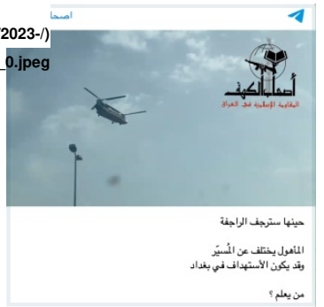
Figure 2: AK threatens to shoot down U.S. manned aircraft, April 20, 2023

ثم سارعت "أصحاب الكهف" إلى تهديد الطائرات المأهولة وفي منشور لاحق ( https://www.washingtoninstitute.org/sites/default/files/2023-04/20230420_0.jpeg ) قالت الجماعة: "المأهول يختلف عن المسير، وقد يكون الاستهداف في بغداد من يعلم" (الشكل 2).