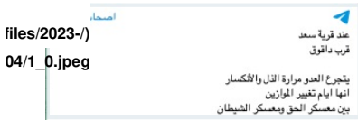
Figure 1: AK implies that it shot down a U.S. drone south of Kirkuk, April 22, 2023

"وعصائب أهل الحق" ( https://www.washingtoninstitute.org/ar/policy-analysis/1mht-amt-n-sayb-ahl-alhq ) رسالة جاء فيها: "عند قرية سعد قرب داقوق [جنوب كركوك] يتجرع العدو مرارة الذل والانكسار. إنها أيام تغيير الموازين بين معسكر الحق ومعسكر الشيطان" (الشكل 1).