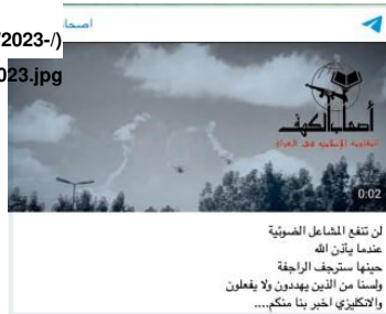
Figure 4: AK issues a second threat to air assets in a week, April 14, 2023

ومن المرجح جداً أن يكون هذا التعليق الغامض الأخير إشارة