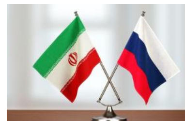
مقاله‌ها و دیدگاه‌ها

(policy-analysis/middle-east-matters-back-normal-region-reaches-out-assad)