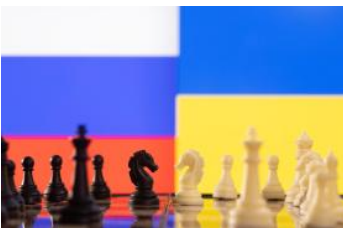
ARTICLES & TESTIMONY

(policy-analysis/russias-disinformation-machine-has-middle-east-advantage)