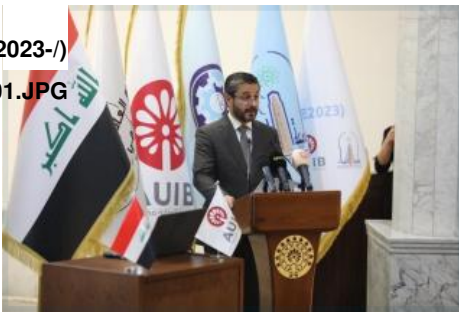
تصویر ۱: نعیم العبودی، وزیر آموزش عالی عراق، در حال سخنرانی در دانشگاه آمریکایی عراق در بغداد، ۱۰ ژانویه ۲۰۲۳.

برای برقراری روابط عملگراییانه با آمریکا داشته است قابل ذکر است که خزعلی از سال ۲۰۱۸ چندین بار از طریق سیاستمداران عراقی به دنبال لابی کردن با واشنگتن بوده است - ولی از وقتی که طبق فرمان اجرایی ۱۳۶۶۳ از ۳ ژانویه ۲۰۲۰ در «لیست تروریست‌های جهانی» آمریکا قرار گرفت این روند متوقف شد.