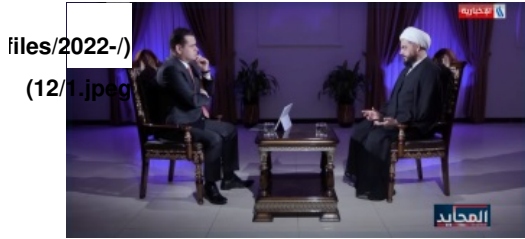
Figure 1: Khazali interviewed by al-Iraqiya TV, November 20, 2022.

في 20 تشرين الثاني/نوفمبر 2022 استضافت قناة "العراقية" زعيم «عصائب أهل الحق» قيس الخزعلي (الشكل 1) الذي تحدّث عن سياسة "المقاومة" تجاه قوات التحالف في الفترة الماضية والأشهر القليلة المقبلة وقال إن «الإطار التنسيقي [الشيعي]» كان منخرطاً في تشكيل الحكومة ومن المؤكد أن تشكيل الحكومة يحتاج إلى الهدوء لذلك أعطت فصائل «المقاومة» هدنة لـ «الإطار التنسيقي» إلى حين اختيار رئيس الوزراء وتشكيل الحكومة". وقد يفسر هذا الأمر التراجع الواضح في العمليات الحركية ضد قوات التحالف في الأشهر القليلة الماضية بما فيها هجمات القوافل اللوجستية التي شكلت بشكل أساسي استعراضاً دعائياً (أدائياً أو مقاومة وهمية) في السنوات الأخيرة.