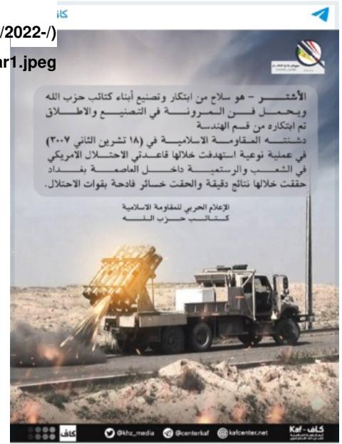
Figure 2: Kaf infographic about the launch of Ashtar in 2007 against two U.S. bases in Iraq, published November 15, 2022. The graphic shows a modern Ashtar multiple rocket launcher variant, not the 2007 version

وتكرر اسم "الأشتر" في «منظمة بدر» ولاحقاً في الوحدات العسكرية ضمن «قوات الحشد الشعبي» علماً أن الاسم يعود إلى أحد صحابة الإمام علي ويعني "السيف". فقد سمي لواء المدفعية في «منظمة بدر» الذي حارب إلى جانب إيران ضد العراق في الحرب بين البلدين - سرايا دعم مدفعية صواريخ «مالك الأشتار». وبعد انسحاب الولايات المتحدة استخدمت «قوات الحشد الشعبي» نسخ معدلة جديدة من "الأشتر" (فلق- 1 عيار 240 ملم وفلق-2 عيار 333