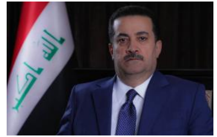
السوداني هو مدير عام: هكذا تنظر المقاومة إلى رئيس الوزراء العراقي الجديد

(ar/policy-analysis/alswdany-hw-mdyr-am-hkdha-tnzz-almqawmt-aly-ryys-alwzra-alraqy-aljdyd/)