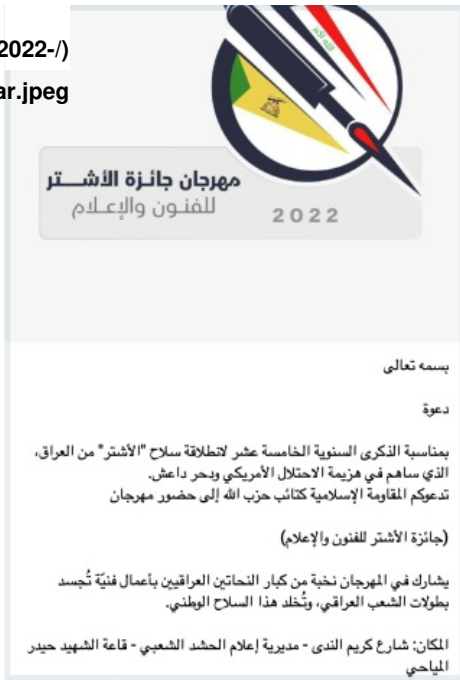
Figure 1: KH's invitation to attend the Ashtar Festival, November 15, 2022

بغداد حيث تم إطلاق 31 قذيفة على مسافات تقل عن 200 متر مما أدى إلى جرح 12 أميركياً (وفي مناسبات أخرى كانت قذائف "الأشتر" مميتة: ففي حادثتين وقعتا في حزيران/يونيو 2011 قُتل 10 أميركيين وجرح 37 آخرين). وتم إخفاء قذائف "الأشتر" بشكل متزايد من قبل «كتائب حزب الله» داخل شاحنات للنفايات وأطلق كل منها ما يصل إلى ثمانية عشر أسطوانة غاز مملوءة بمادة "سي 4" المتفجرة دُفعت بزوايا عالية باستخدام عبوات دفع الصواريخ التي تصنعها إيران