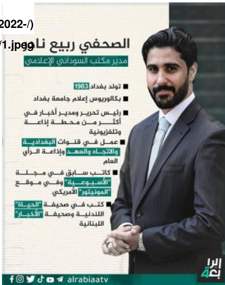
Figure 1: Al-Rabaa TV publishes an infographic about Nader, October 31, 2022

الوطنية التي اندلعت في الوقت نفسه تقريباً أوقفت كلاً من طموحات «عصائب أهل الحق» والتقدم الذي أحرزه نادر وأجبرت عبد المهدي على الاستقالة في النهاية وبناءً على ذلك بقي نشاط نادر هامداً داخل "مكتب رئيس الوزراء" في انتظار قدوم رئيس وزراء آخر أكثر ودية مع «عصائب أهل الحق» وجماعات المقاومة الأخرى لكي يتمكن من تولي الدور الذي ينوي القيام به