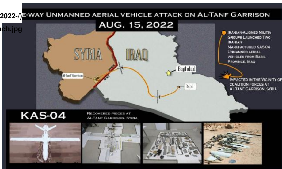
تصویر شماره ۱: تصویر گرافیکی مسیر پهپادهای کی.ای.اس-۴. از استان بابل عراق به التنف در سوریه

فرماندهی مرکزی ایالات متحده (سننگام) در مورد حمله ۱۵ آگوست تایید کرده است که پهپادهای کی.ای.اس-۴، از یک سایت پرتاب در استان بابل عراق (تصویر شماره ۱) به سمت التنف فرستاده شده‌اند. کر نام این استان مهم است زیرا اغلب در محافل ایالات متحده به جای اشاره به مجتمع «جُرف الصخر» به کار می‌رود که اداره آن با گروه کتائب حزب‌الله است. این گروه در فهرست سازمان‌های تروریستی ایالات متحده قرار دارد. جرف الصخر یک منطقه نظامی بسته است که کتائب حزب‌الله اجازه دسترسی کامل به آن را حتی به کارکنان دولت فدرال عراق نیز نمی‌دهد. در ۱۳ مارس ۲۰۲۰ این منطقه هدف حملات هوایی متعدد ایالات متحده قرار گرفت که طی آن به یک رشته از کارگاه‌ها، انبارها و تاسیسات آزمایش مهمات متعلق به کتائب حزب‌الله آسیب وارد شد. این عملیات در پاسخ به کشته شدن یک آمریکایی و یک بریتانیایی در ۱۱ مارس در پایگاه التاجی صورت گرفت.