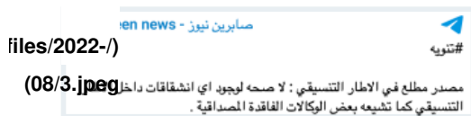
Figure 3: Sabreen news emphasizing that there is no schism within SCF, August 2, 2022

وبعد نشر هذا البيان شعرت شبكة "صابرين نيوز" https://www.washingtoninstitute.org/ar/policy-analysis/lmht-amt-n-sabryn-nywz ) بأنّها مضطرة إلى طمأنة قواعدها "المقاومة" في الساعات المبكرة من يوم 2 آب/أغسطس [بإعلانها] بأن "الإطار التنسيقي" والمقاومة بألف خيرٍ ونقلت عن أحد المصادر في "الإطار التنسيقي" قوله: "لا صحة لوجود أي انشقاقات داخل "الإطار التنسيقي" كما تشيخه بعض الوكالات الفاقدة المصداقية" (الشكل 3).