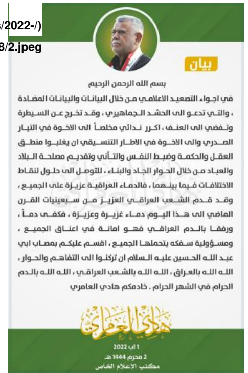
.Figure 2: Statement of Hadi al-Ameri, August 1, 2022

اخر داخل "الإطار التنسيقي" - sites/default/files/2022-/) و (08/2.jpeg) نهج بديل وهو: إبطاء عملية تشكيل الحكومة ومحاولة إعادة التقريب بين البيت الشيعي من خلال استمالة الصدر بالإغراءات ويقود هذه الكتلة الفرعية البديلة هادي العامري (زعيم "منظمة بدر"