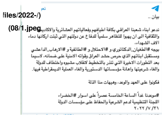
Figure 1: Statement of the Organizing Committee to Support Legitimacy and Preserve State Institutions, July 31, 2022

اخر داخل "الإطار التنسيقي" - sites/default/files/2022-/) و (08/2.jpeg) نهج بديل وهو: إبطاء عملية تشكيل الحكومة ومحاولة إعادة التقريب بين البيت الشيعي من خلال استمالة الصدر بالإغراءات ويقود هذه الكتلة الفرعية البديلة هادي العامري (زعيم "منظمة بدر"