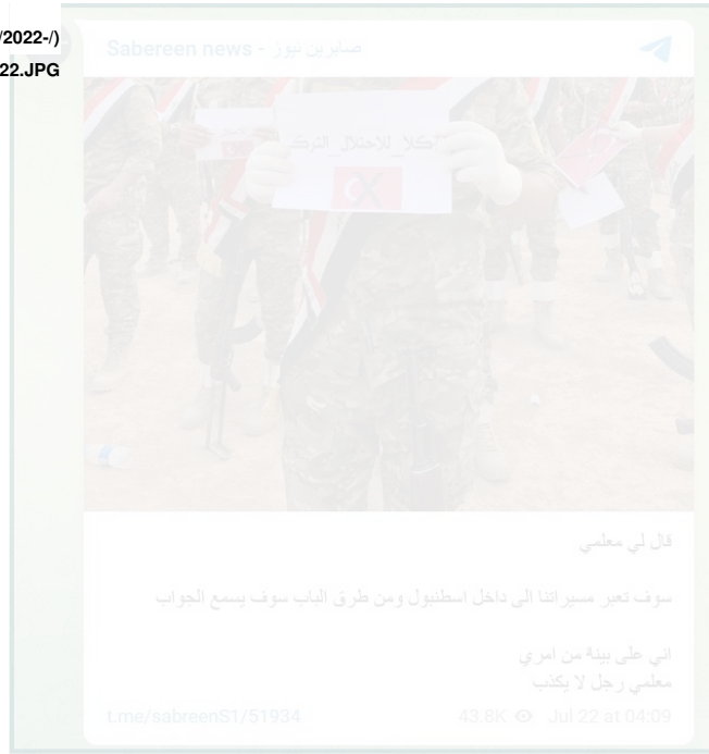
Figure 4: Sabereen News threat to Istanbul, July 22, 2022

والملفت أيضاً هو أن منشور "صابرين نيوز" في 22 تموز/يوليو أُنذر بهجوم أبعاد مدى بواسطة طائرة مسيرة على اسطنبول. واستخدمت القناة عبارة "معلمي" التي تدل عادةً على بلاغ صادر عن أحد كبار المسؤولين الإيرانيين أو قائد ميليشيا/تنظيم إرهابي وأوردت "صابرين" ما يلي: "قال لي معلمي إن طائراتنا المسيرة ستطال اسطنبول ومن طرق الباب سوف يسمع الجواب". ولا تُعتبر ضربة مماثلة مستبعدة بالنظر إلى الهجمات التي شنتها الميليشيات المدعومة من إيران مؤخراً بواسطة طائرات بدون طيار من العراق ضد أهداف في الرياض ومنشآت نفط في الخليج وأهداف في أبو ظبي. ❖