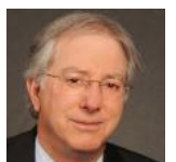
دنیس راس (fa/experts/dnys-ras-0/)

آمار هرمان محقق ارشد موسسه دموکراسی اسرائیل و مدیر دانشگاهی مرکز خانواده و پتریسی برای تحقیقات افکار عمومی و سیاست است.