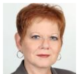
تامار هرمان (fa/experts/tamar-hrman/)

آمار هرمان محقق ارشد موسسه دموکراسی اسرائیل و مدیر دانشگاهی مرکز خانواده و پتریسی برای تحقیقات افکار عمومی و سیاست است.