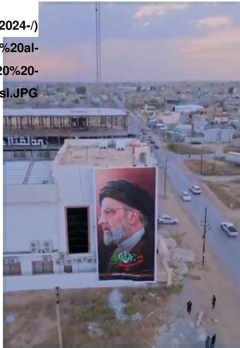
الشكل 1: مجمع سيد الشهداء الثقافي في سهل نينوى يرفع لافتة حداد للرئيس رئيسي 23 مايو/أيار 2024

sites/default/files/2024-/ 06/Sayyid%20al- Shuhada%20centural%20ctr%20%20- (%20Raisi.JPG