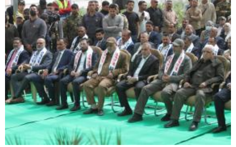
كيفية استخدام مقالات سلسلة "الأضواء الكاشفة للمليشيات": اللامحات العامة

(ar/policy-analysis/kyfyt-astkhdam-mqalat-slslt-aladwa-alkashft-lmylyshyat-allmhat-alamt/)