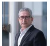
زهر پالتی ( fa/experts/zwhr-palty/ )

نیکولای ملادینوف هموند برجسته و مهمان سیگال در انستیتو واشنگتن است. سیاستمدار و دیپلمات وزیده بلغاری است که اخیراً در مقام هماهنگ کننده ویژه سازمان ملل برای روند صلح خاورمیانه خدمت کرده است.