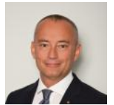
نیکولای ملادینوف ( fa/experts/nyklay-mladynwf/ )

نیکولای ملادینوف هموند برجسته و مهمان سیگال در انستیتو واشنگتن است. سیاستمدار و دیپلمات وزیده بلغاری است که اخیراً در مقام هماهنگ کننده ویژه سازمان ملل برای روند صلح خاورمیانه خدمت کرده است.