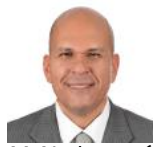
کریم حجاج ( fa/experts/krym-hjar/ )

کریم حجاج مدت بیست و پنج سال در دستگاه دیپلماسی مصر خدمت کرده است.