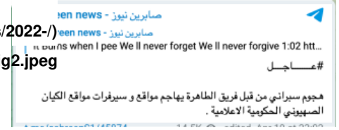
Figure 2: Sabereen news' breaking news about cyber-attacks on Israeli websites, April 20, 2022

في أعقاب هذا الهجوم الإلكتروني الأولي على مواقع إلكترونية إسرائيلية تعقد "فريق الطاهرة" و"صابرين نيوز" وعدد من القنوات الأخرى التابعة لهما بشنّ المزيد من الهجمات. وفي اليوم التالي في 20 نيسان/أبريل نشرت "صابرين نيوز" رسالة تحت رقم "21" وشعار السلطات الثلاث الخضراء والتي يبدو أنها اختيرت كرمز لـ "فريق الطاهرة". ويبدو أن هذا المنشور قد تمّ تصميمه من قبل "صابرين نيوز" كتحذير مسبق لمزيد من الهجمات السيبرانية. وفي الساعة 21:00 بتوقيت بغداد تعرّض الموقع الإلكتروني لـ "سلطة المطارات الإسرائيلية" لهجوم وتم تعطيله. إلا أنه عاد إلى الخدمة في غضون دقائق.