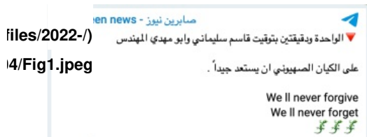
Figure 1: Sabreen's post announcing the upcoming cyber-

نجح الهجوم (الذي تم تصنيفه على أنه "هجوم حجب الخدمة" [الحرمان من الخدمات] / "رفض الخدمة الموزعة" [أو هجوم "DDoS"]) (أي إرسال سيل من البيانات غير