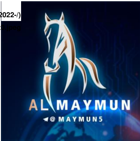
تصویر ۱: لوگوی المیمون

المیمون به فوریت شروع به پست کردن نظرات و اظهاراتی کرد که در حالت عادی از کانال اصلی صابریں پخش می شد و در نتیجه تبلیغ هواداران صابریں تعداد اعضای این کانال فرعی ناگهان رشد کرد در عمل فعالیت صابریں تحت برند دیگری در کنترل همان افرادی که پشت حساب های اصلی بودند ادامه یافت