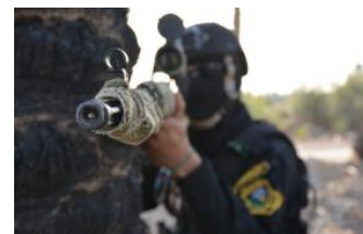
موج ترور شبه نظامیان (۲): حملات دسامبر

(/policy-analysis/pwshsh-akhbar-awkraayn-dr-sabryn-tqdyd-az-rwshy-ba-shq)