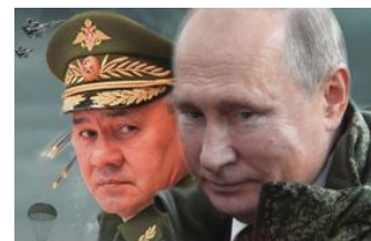
پوشش اخبار اوکراین در صابرین تقدیم از روسیه با عشق

(/policy-analysis/how-use-militia-spotlight)