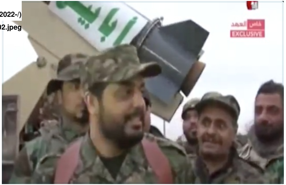
Figure 2: Qais al-Khazali launches Ababil IRAM

مقطع فيديو يُظهر هجمات مزعومة على قواتي في بغداد والفلوجة ومحافظة السليمانية (الشكل 4). ويشير هذا بوضوح إلى أن "ردع" هي منصة على "تلغرام" أنشئت للترويج لجماعة «سرايا أبابيل».