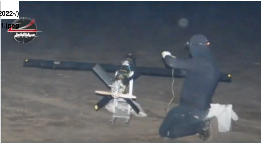
Figure 1: SA claiming three attacks on U.S. positions, January 7, 2022

( https://www.washingtoninstitute.org/ar/policy-analysis/lmht-amwt-n-ktayb-hzb-allh ) " بما فيها "الوحدة 10000 )