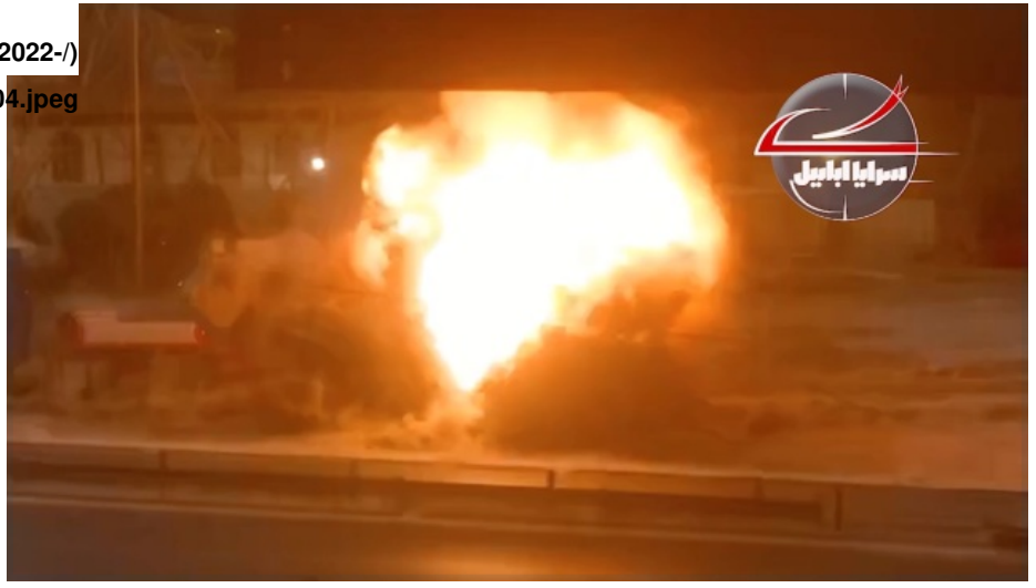
Figure 4: Radea's clip showing purported convoy attacks by SA, September 1, 2021