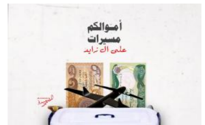
«كتائب حزب الله» وراء حملة التبرعات

كيفية استخدام مقالات سلسلة "الأضواء الكاشفة للميليشيات" ar/policy-analysis/kyfyt-astkhdam-mqalat-slsit-aldwa-alkashft-llmylyshyat