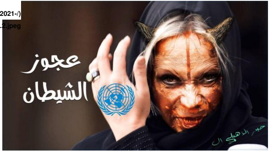
Figure 2: A graphic posted on a few muqawama social media chaniles calling head of UNAMI, Ajouz al-Shaytan , October 17, 2021.

بلاسخرت على حسابه على "تلغرام" بدت sites/default/files/2021-/) فيها السنة نار ودبابة تخرج من وجهها وقد أرفقها بعبارة باللغة الإنكليزية جاء فيها: "ستكون معاملتك كمعاملة القوافل الأمريكية" (الشكل 3). ويعتبر ذلك إشارة إلى حملة "المقاومة" للاعتداء على القوافل اللوجستية الأمريكية بهجمات بالمفجرات. وأُعيد نشر الصورة على القناة المؤثرة "صابرين نيوز