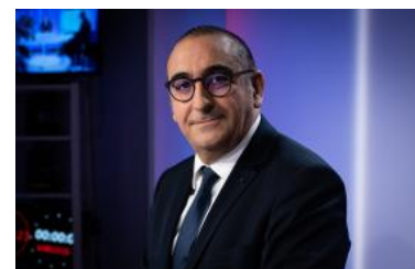
مقابله با تهدیدهای قدیمی و جدید: دیدگاه فرانسه در مبارزه با تروریسم (fa/policy-analysis/mqablh-ba-thdydhay-qdymy-w-jdyd-dydgah-fransh-dr-mbarzh-ba-trwrism/)