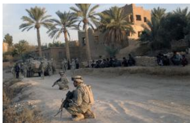
The War on Jihadism: Lessons from Twenty Years of Counterterrorism (/policy-analysis/war-jihadism-lessons-twenty-years-counterterrorism)