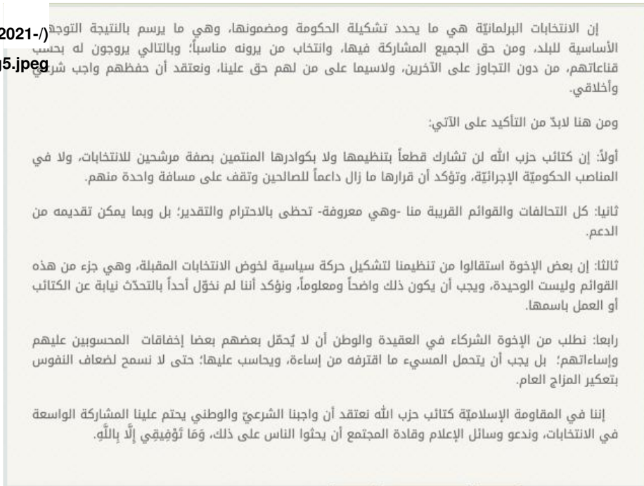
Figure 5: KH statement trying to mend the rift with AAH, August 8, 2021