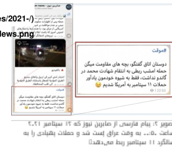
تصویر ۲: پیام فارسی از صابرین نیوز که ۱۲ سپتامبر ۲۰۲۱ ساعت ۵:۰۰ به وقت عراق پست شد و حملات پهیادی را به سالگرد ۱۱ سپتامبر ربط می‌دهد.

با توجه به این اخطار حملات پهیادی ۱۱ سپتامبر چند احتمال قابل تأمل را نشان می‌دهد: