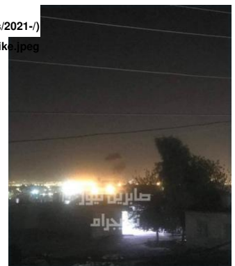
تصویر ۱: تصویر ۱۲ سپتامبر از صابرین نیوز که بنا به ادعا حمله هوایی به اربیل را نشان می‌دهد.

عجیب آن است که صابرین ظاهراً دارد شایعانی را تکذیب می‌کند که بر اساس آنها این حمله پهیادی به خاطر مرگ شخصیتی سپاهی در سرپال گاندو بوده که سرپالی حادثه‌ای-جاسوسی است و یا حمایت سیاه تولید می‌شود (https://www.ipost.com/middle-east/new-iranian-tv-show-attempts-to-cast-irgc-in-new-light-594828).